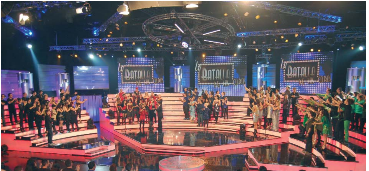
El plató que utilizó Boomerang TV para La Batalla de los Coros (Cuatro) pertenece a UVESTUDIOS